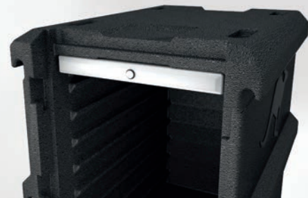
Einschubrillen für Hot- und Coolpack