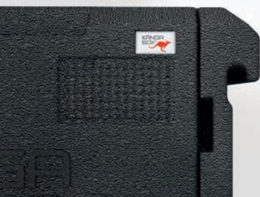
Dicht schließende Tür – keine Gerüche