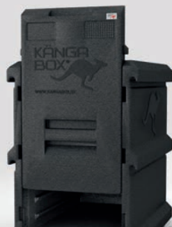
Herausnehmbare Schiebetür für einfachen Zugang