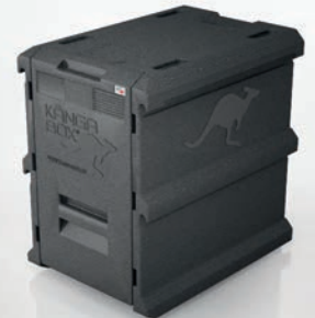
Stabil aus einem Stück: für eine lange Lebensdauer