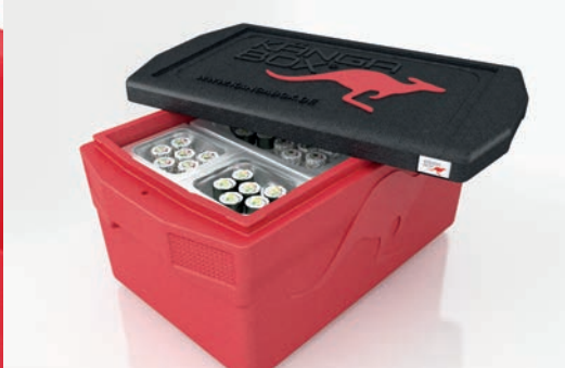
Passend für Gastronorm-Behälter