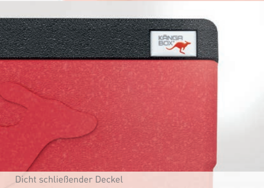
Dicht schließender Deckel