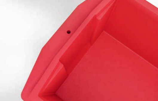
Griffmulde für leichtes Entnehmen