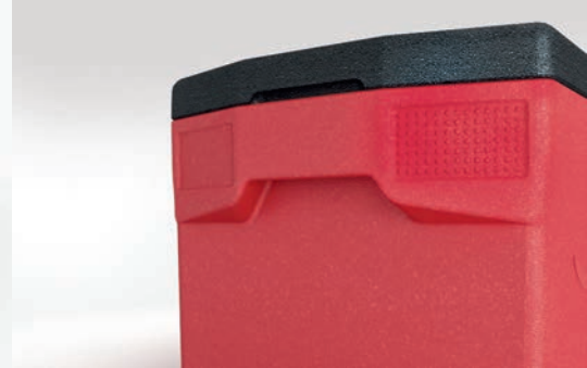
4 Etikettenfelder und ergonomisch geformte Tragegriffe