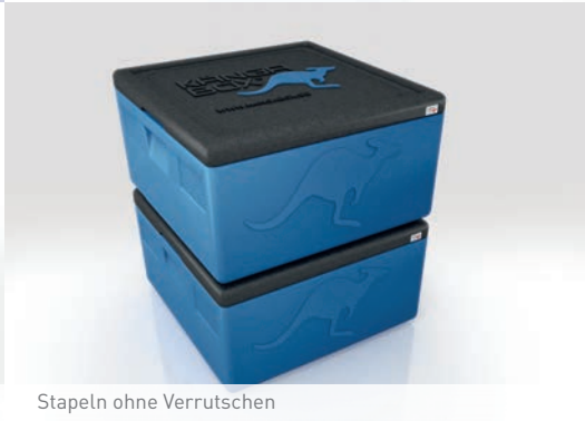
Stapeln ohne Verrutschen