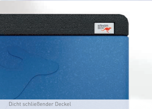
Dicht schließender Deckel