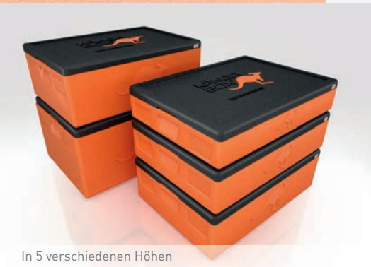
In 5 verschiedenen Höhen