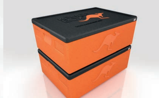
Stapeln ohne Verrutschen