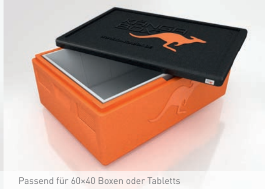
Passend für 60x40 Boxen oder Tablett