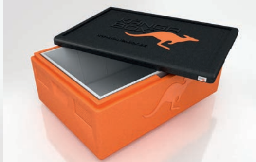
Passend für 60x40 Boxen oder Tablett