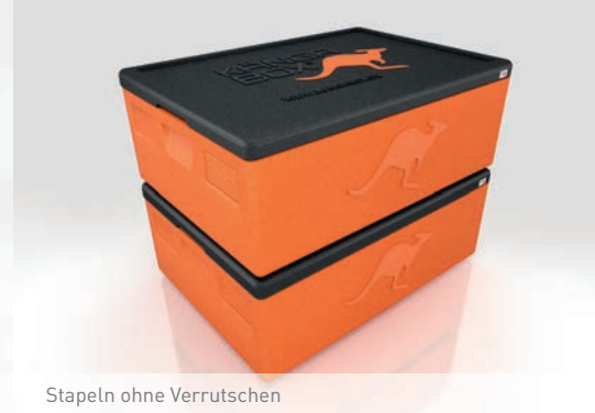
Stapeln ohne Verrutschen