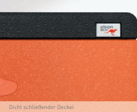
Dicht schließender Deckel