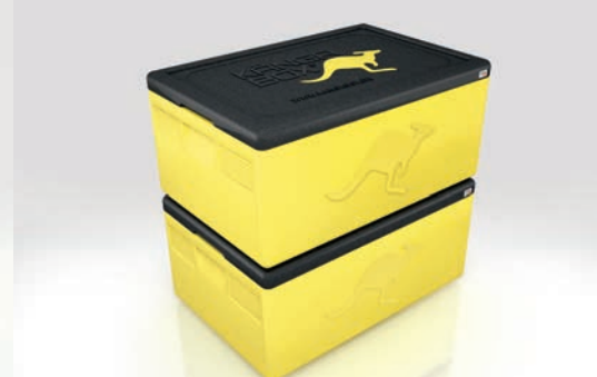
Stapeln ohne Verrutschen