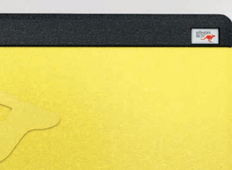
Dicht schließender Deckel