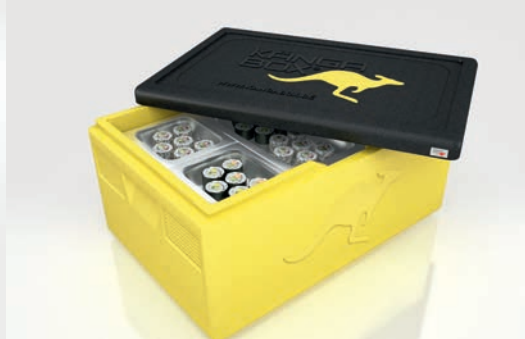
Passend für Gastronorm-Behälter