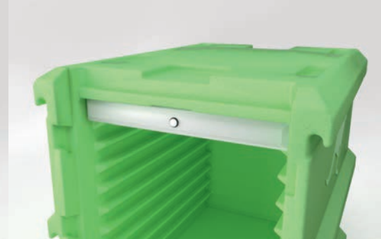
Einschubrillen für Hot- und Coolpack