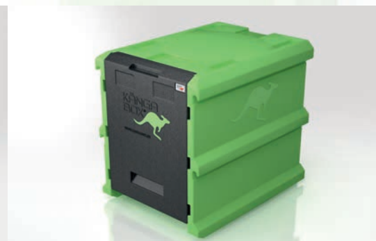
Stabil aus einem Stück: für eine lange Lebensdauer