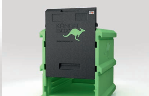
Herausnehmbare Schiebetür für einfachen Zugang