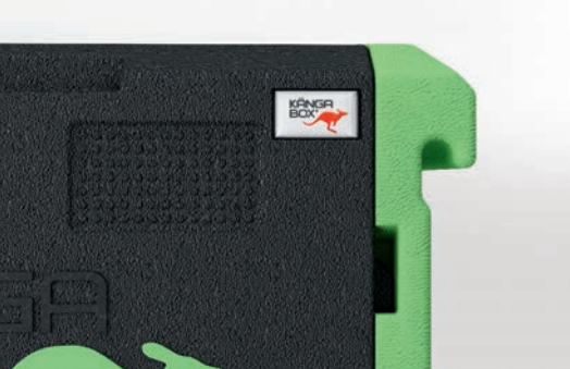
Dicht schließende Tür – keine Gerüche