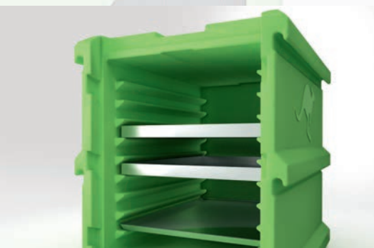
Wahlweise 10 oder 6 Einschubrillen